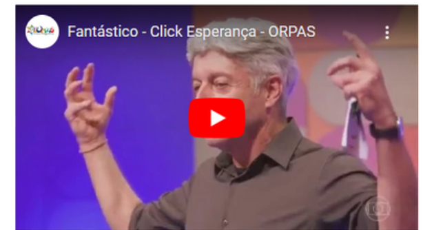
Fantástico - Tv Globo Click Esperança - ORPAS