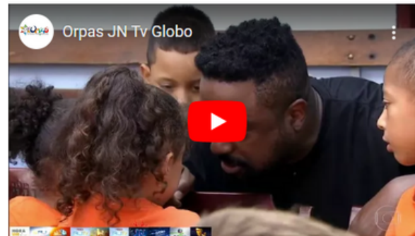
Jornal Nacional Tv Globo - ORPAS